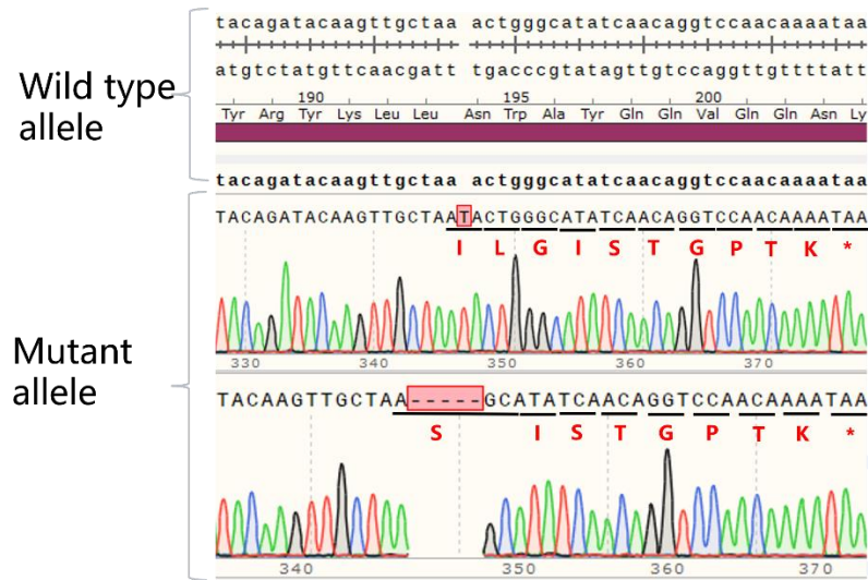
Fig2. The Sanger sequencing of the H_STEAP1 KO LNCaP Cell Line showed successful knockout of STEAP1.